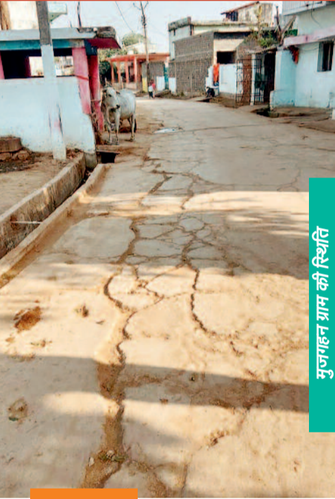
मुजगहन ग्राम की स्थिति