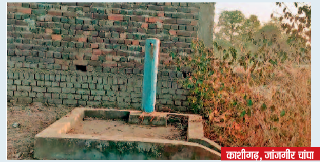
काशीगढ़, जांजगीर चांपा

फंड जारी नहीं होने से 43 गांव नहीं बन पाए आदर्श ग्राम इस योजना के तहत रायपुर जिले में वर्ष 2014 से वर्ष 2021 तक कुल 68 गांवों को शामिल किया गया था। इसके बाद वित्तीय वर्ष 2022-23 में 35 अन्य गांवों का चयन आदर्श ग्राम बनाने के लिए किया। इसी प्रकार वित्तीय वर्ष 2025-26 में भी 6 गांवों का चयन हुआ है। इस तरह जिले में कुल 109 गांवों का चयन हुआ है, जिनमें से 66 गांवों को योजना के तहत फंड जारी कर उन्हें आदर्श ग्राम के रूप में विकसित किया है।