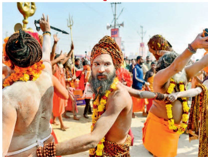
प्रयागराज। मौनी अमावस्या पर माघ मेल में अमृत स्नान के लिए जाते हुए साधु-संत एवं नामा बाबा।